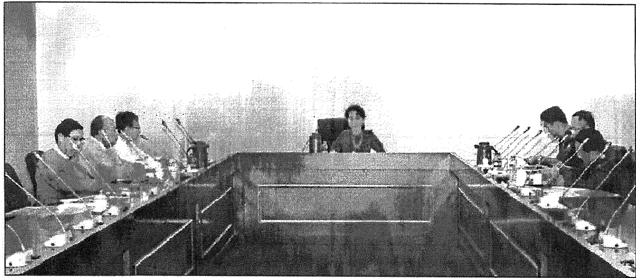
Daw Aung San Suu Kyi and Union Ministers hold the emergency meeting following terrorist attacks on police outposts in Rakhine State.

At that moment, arrangements were made to deploy additional Myanmar Police Force personnel to the region, while